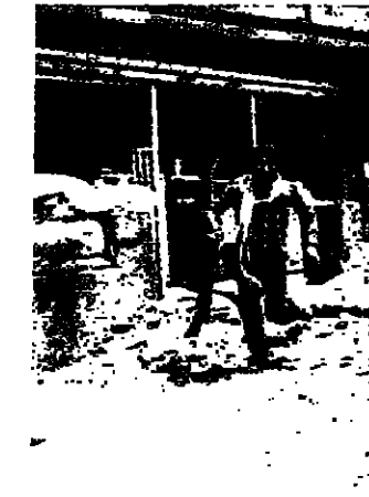
الجرارة ترفع اكياس الرمل في الشياح